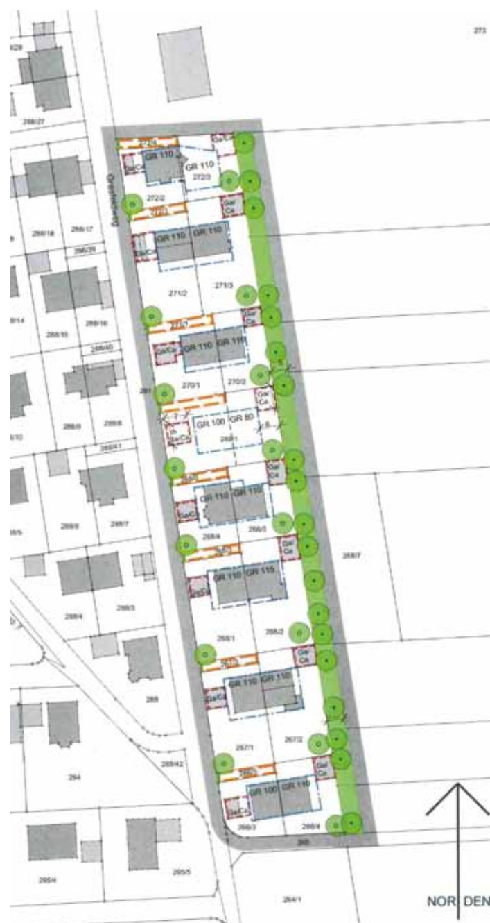
Bebauungsplan Nr. 37 a Oberding Grasfeldweg Erweiterung